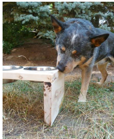
Rozhodně zkoušel, jestli se někde neschová přídavek.