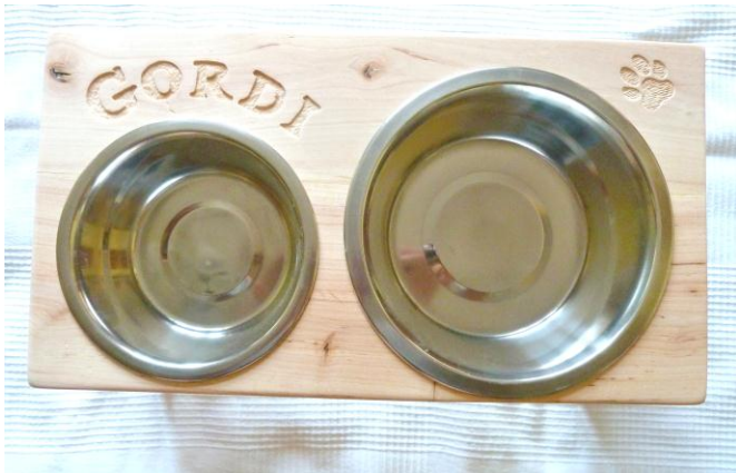
Nad menší miskou na jídlo je jméno, v pravém rohu tlapka – jen tak.