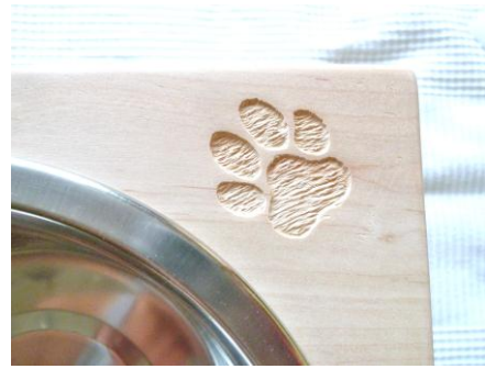
Tlapička je mělká a jinak šrafovaná, aby byla zajímavá.