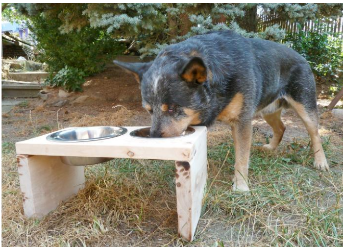
Nechtěl se postavit normálně, protože v něm bylo sušené masíčko.