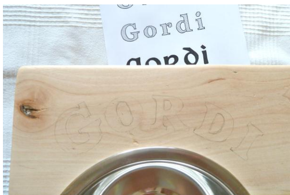
Vybrala jsem font, který se mi líbil a překreslila na dřevo.