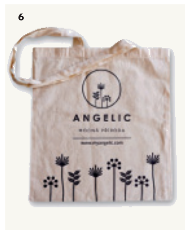
4 Voskovaný ubrousek Bag Me, bavlna ošetřená směsí včelího vosku, pryskyřice a rostlinného oleje, 38 × 38 cm, Bagme.net, 235 Kč 5 Miska , kokosový ořech, v. 5 cm, Ø 10 cm, Minimumwaste.cz, 259 Kč 6 Nákupní taška , Angelic, bavlna, 36 × 35 cm, Folly.cz, 149 Kč